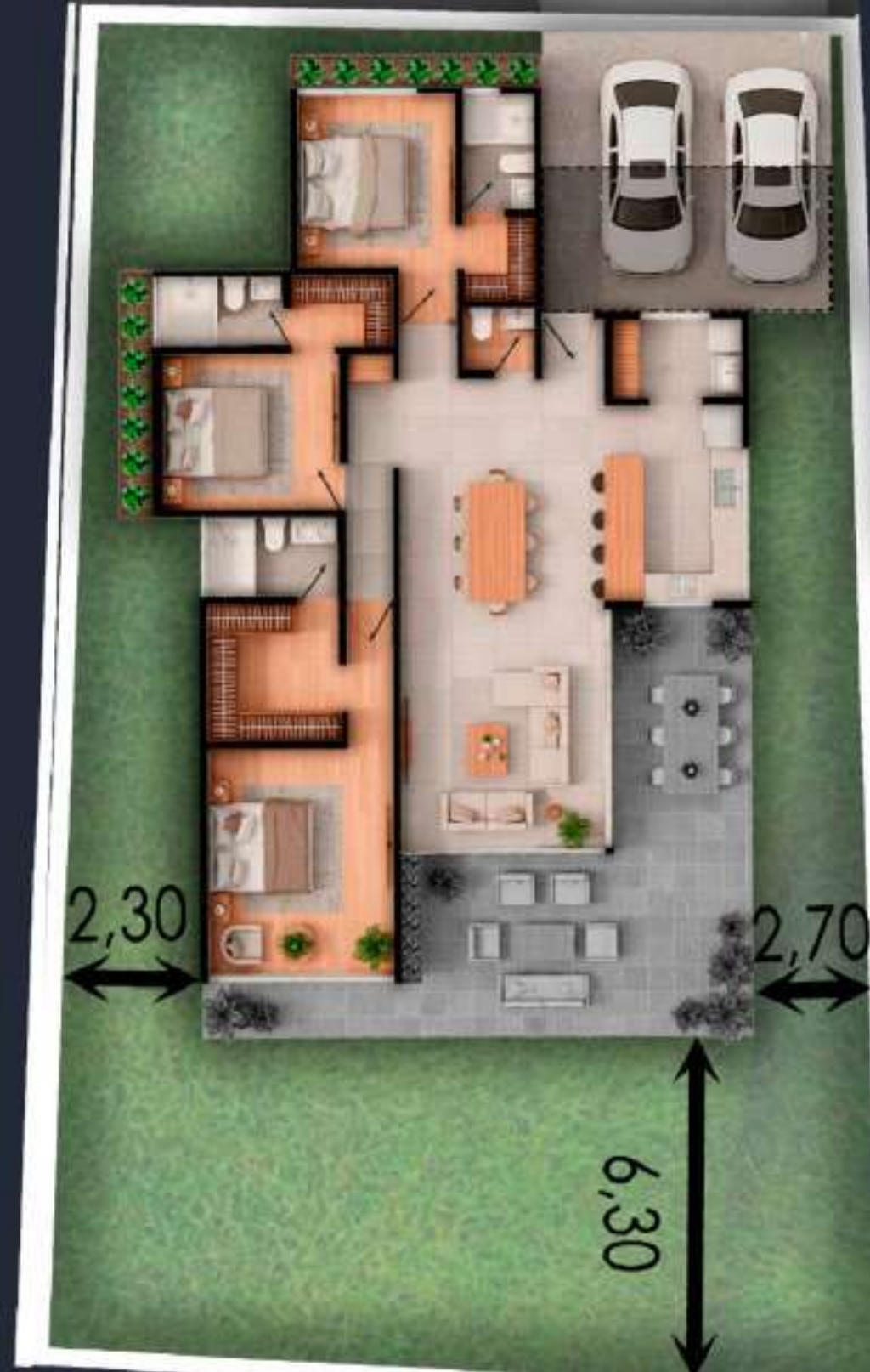
03B AREA DEL LOTE 409 M2