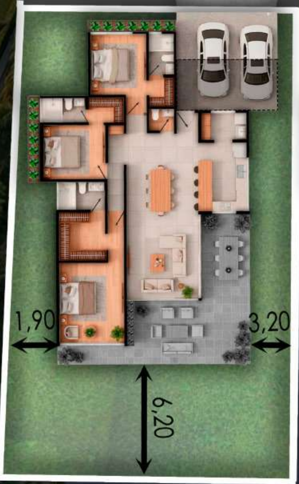
02B AREA DEL LOTE 406 M2