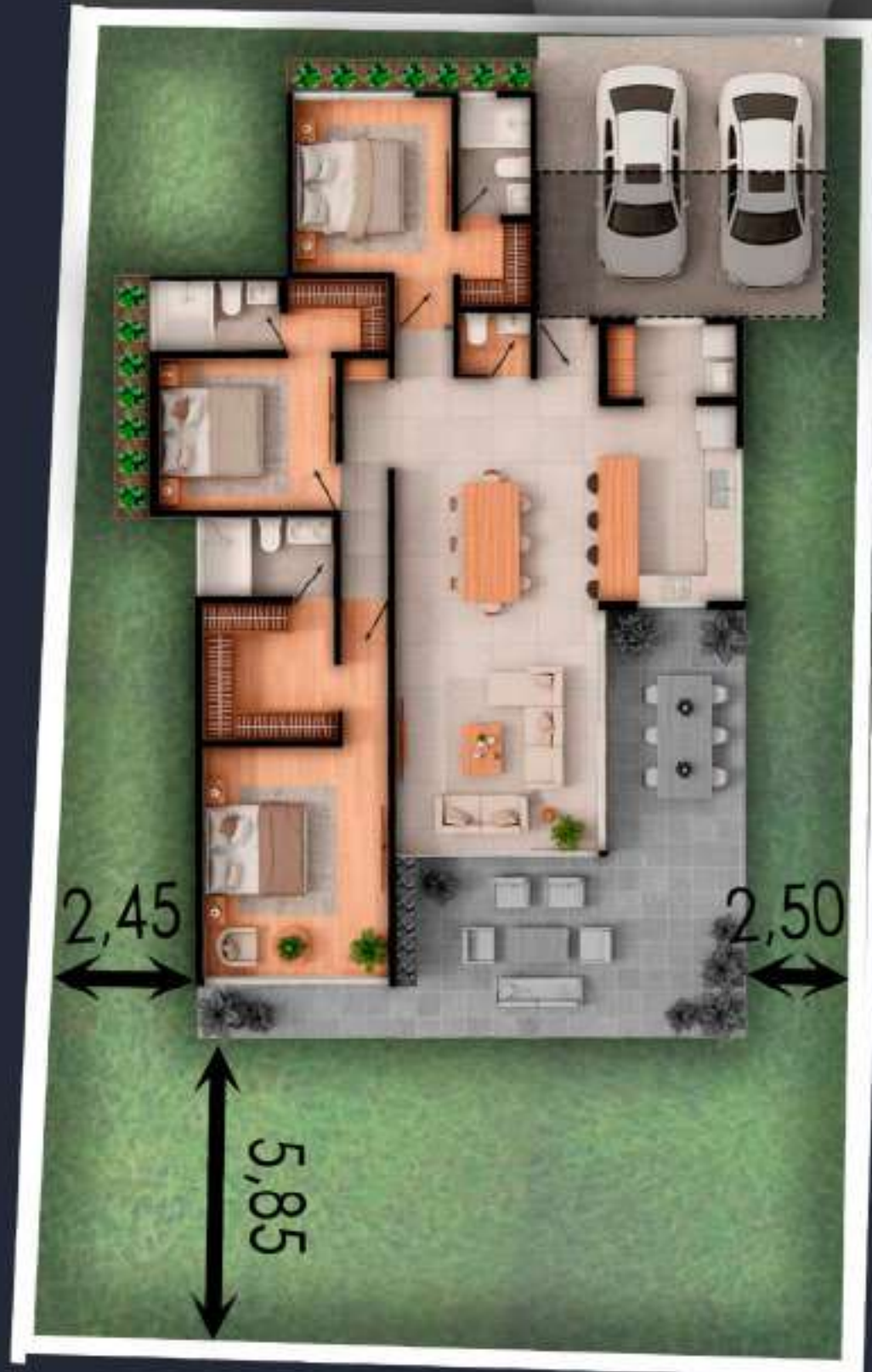
03A AREA DEL LOTE 402 M2