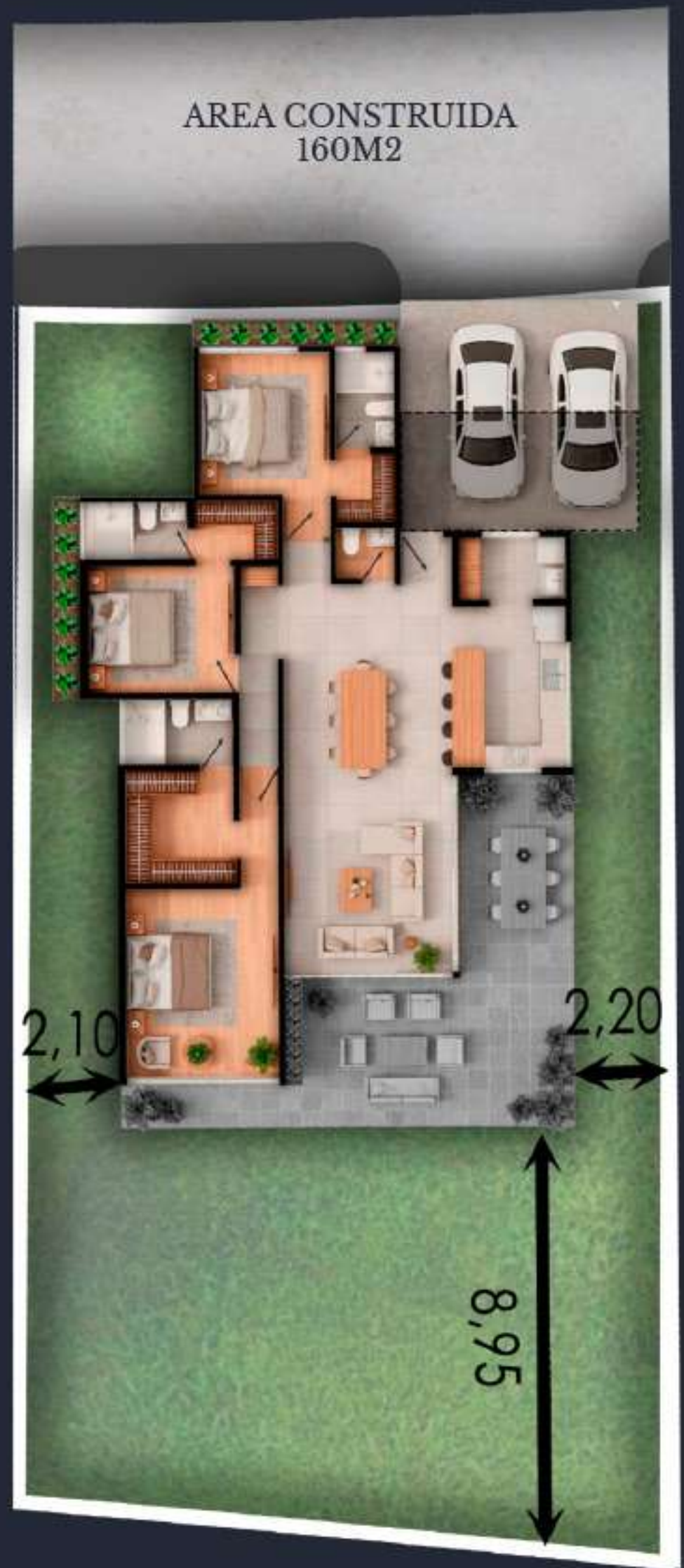
05 AREA DEL LOTE 465 M2