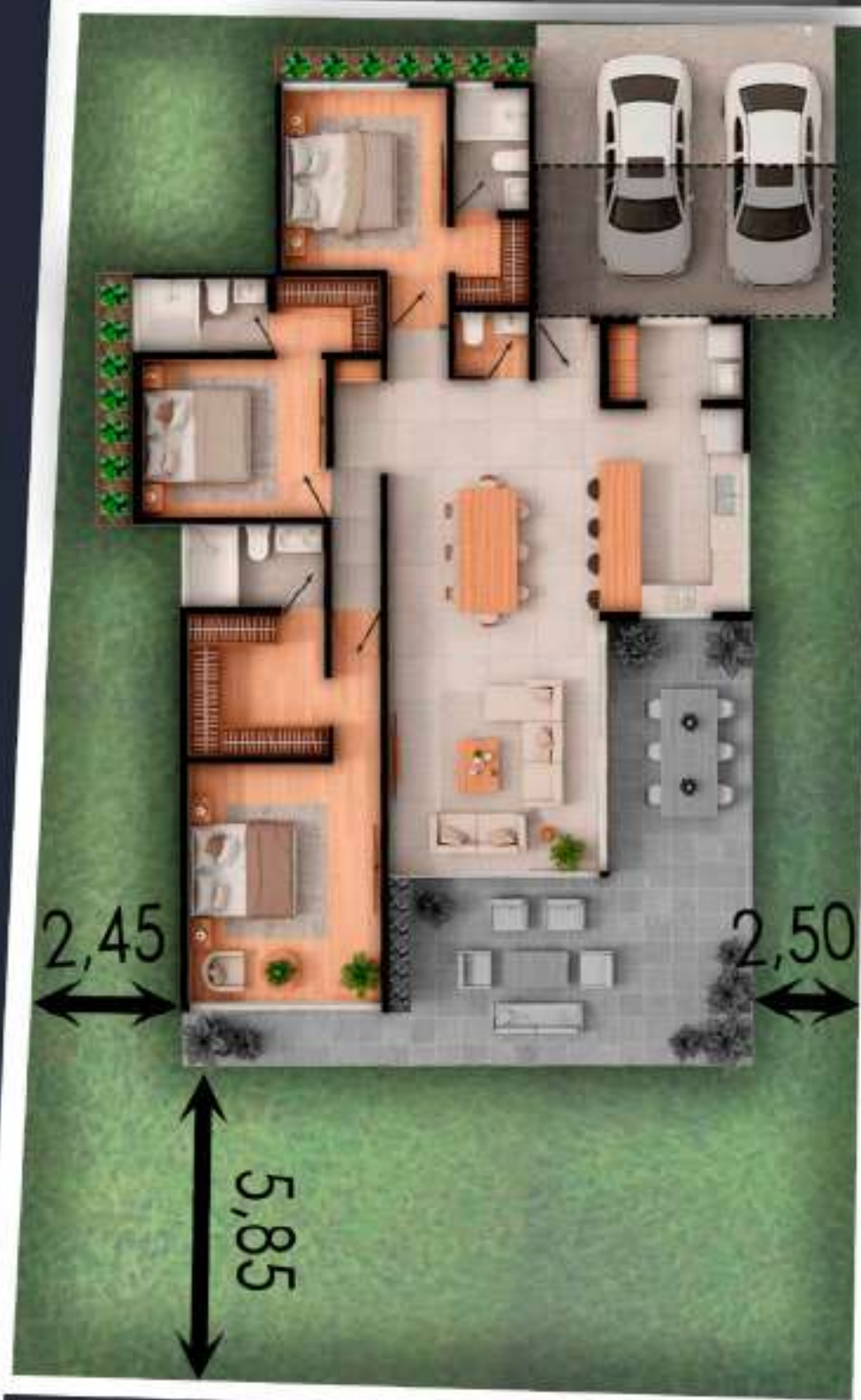
03A AREA DEL LOTE 402 M2