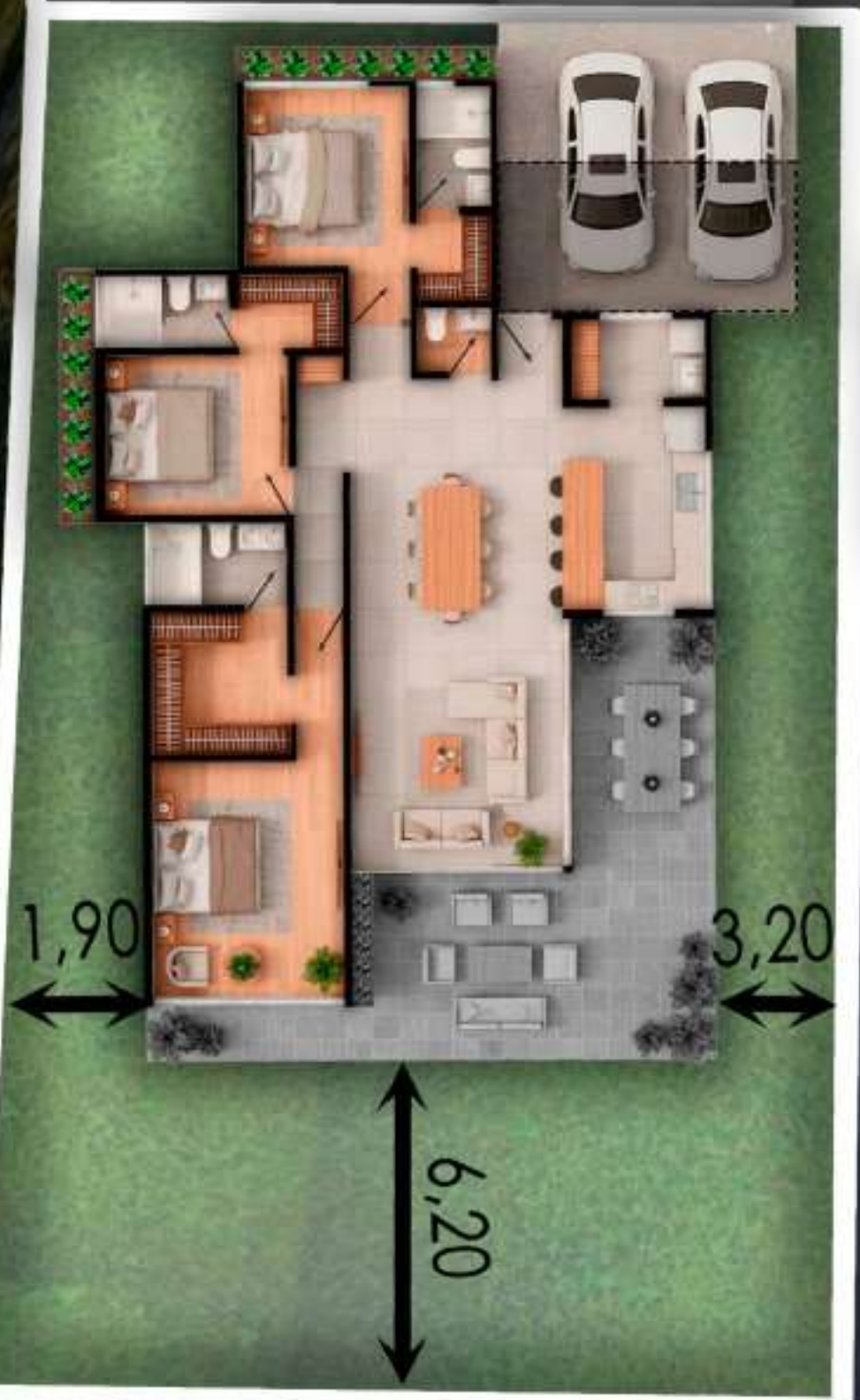
02B AREA DEL LOTE 406 M2