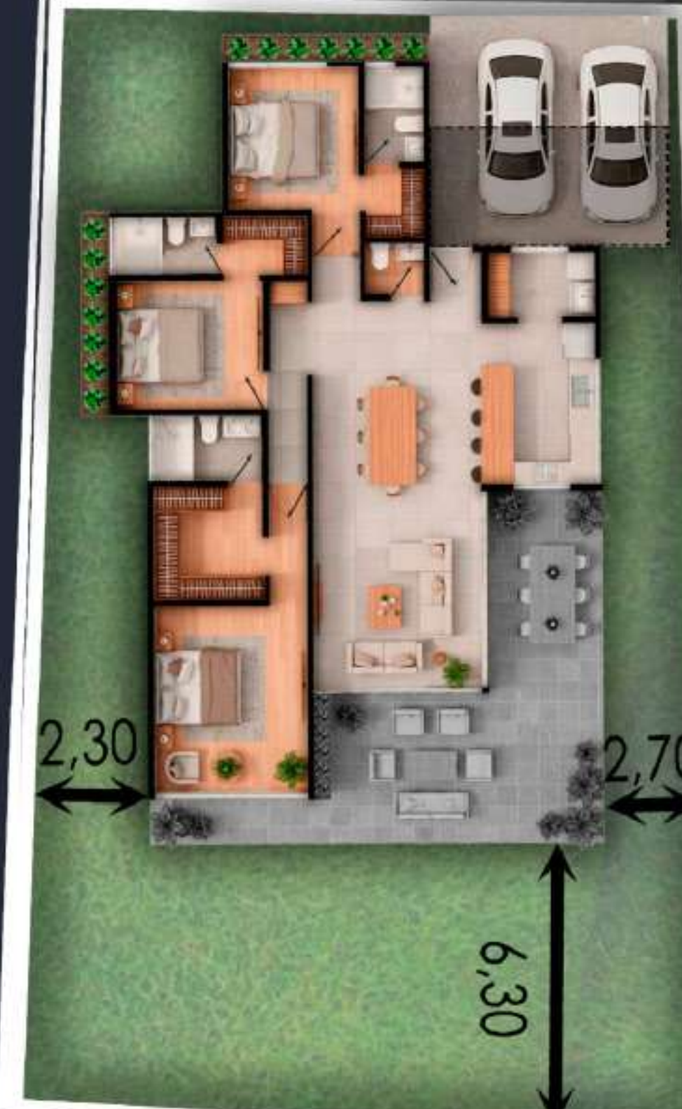
03B AREA DEL LOTE 409 M2