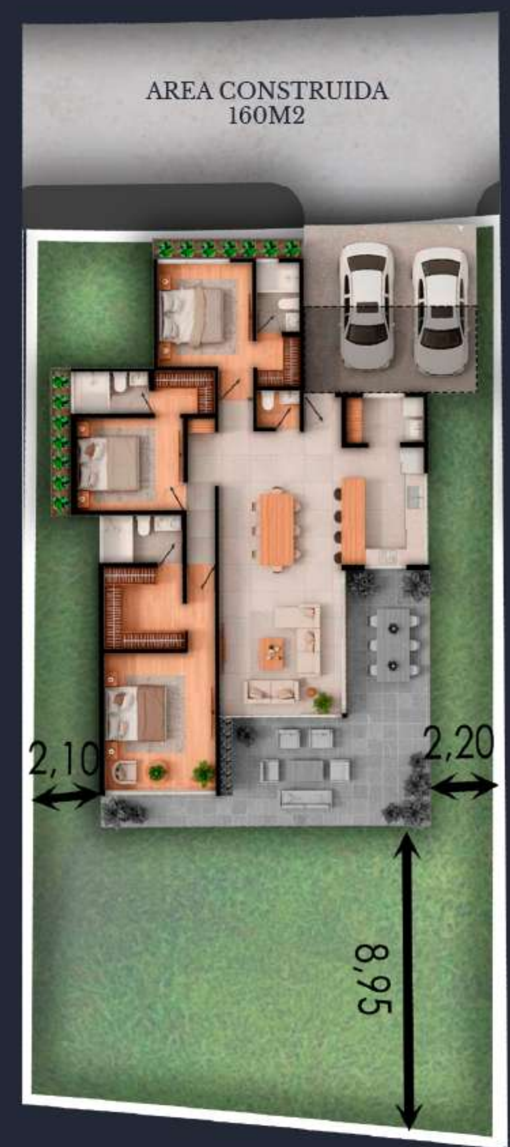
05 AREA DEL LOTE 465 M2