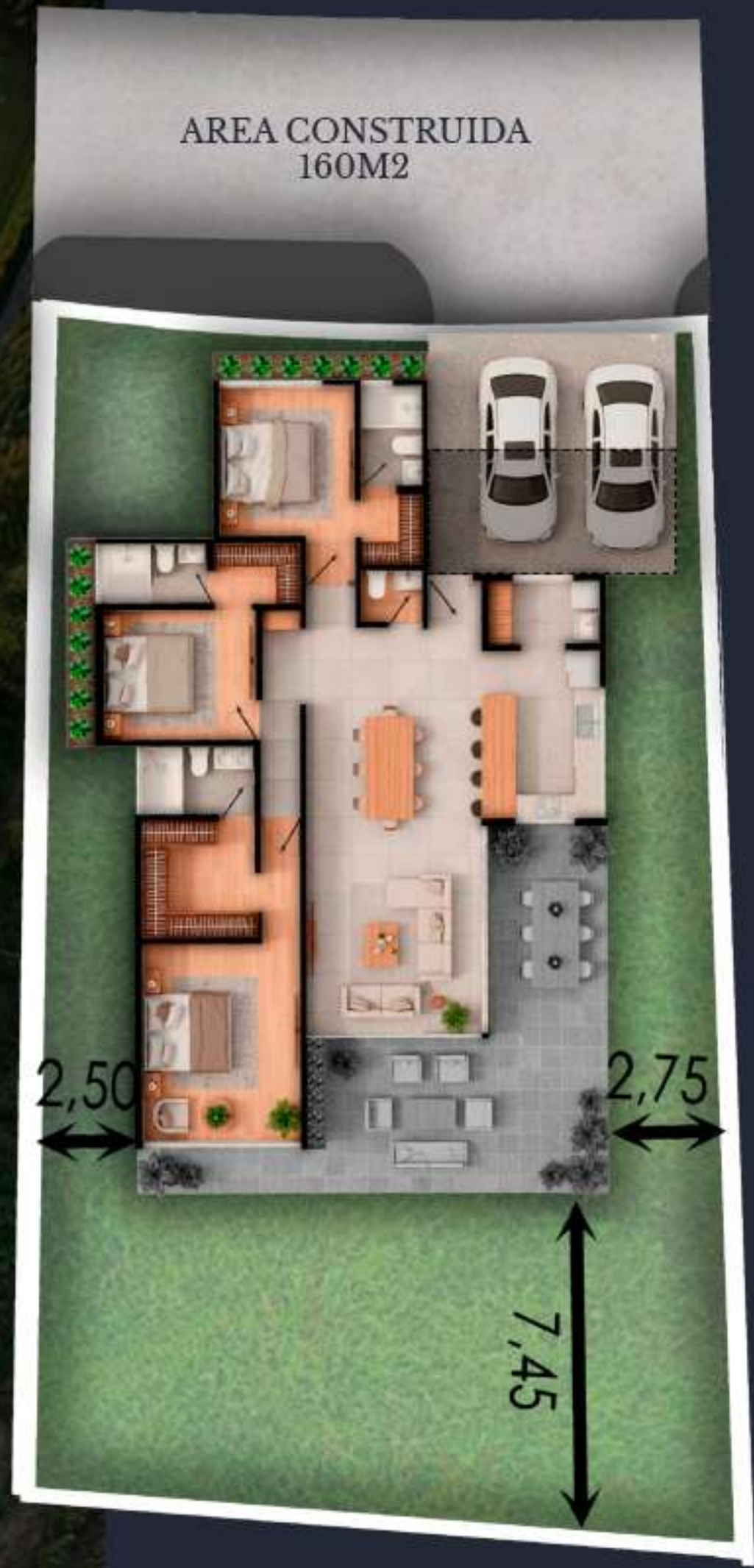
04A AREA DEL LOTE 427 M2