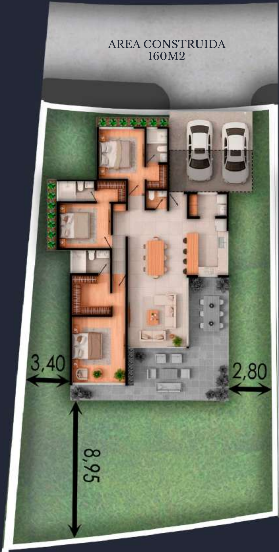
01B AREA DEL LOTE 454 M2