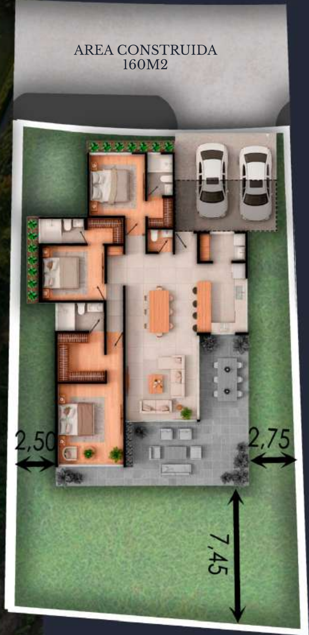
04A AREA DEL LOTE 427 M2