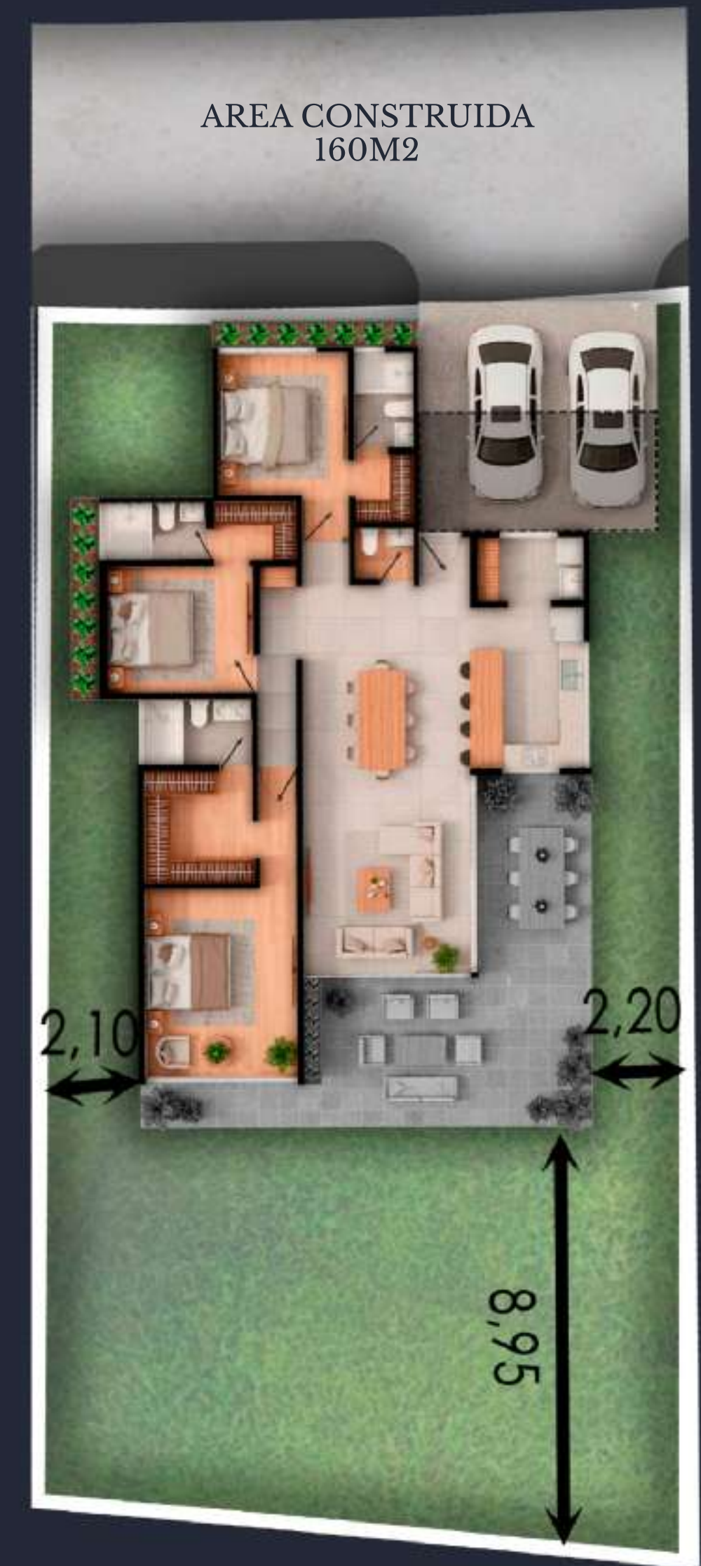
05 AREA DEL LOTE 465 M2