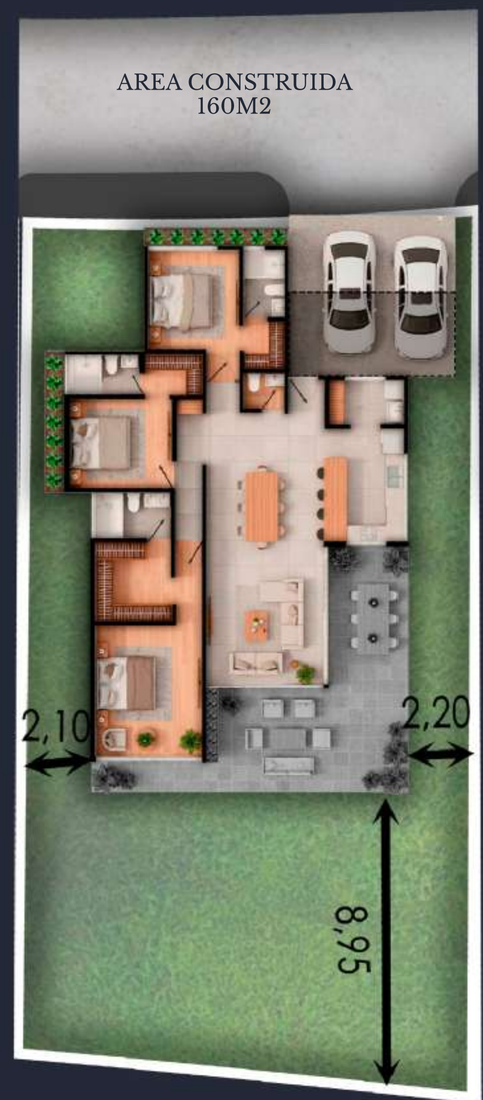
04B AREA DEL LOTE 431 M2