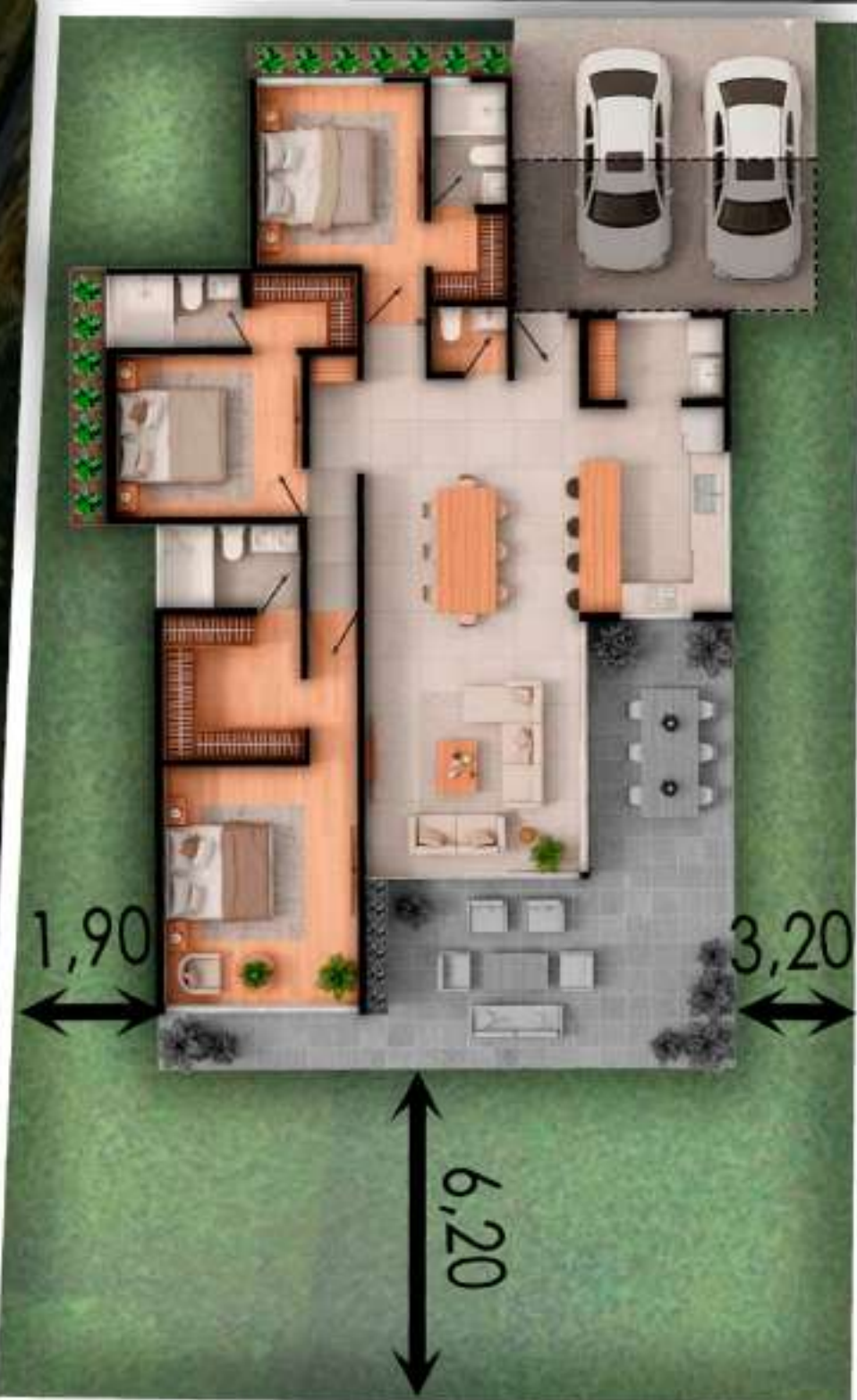
02B AREA DEL LOTE 406 M2