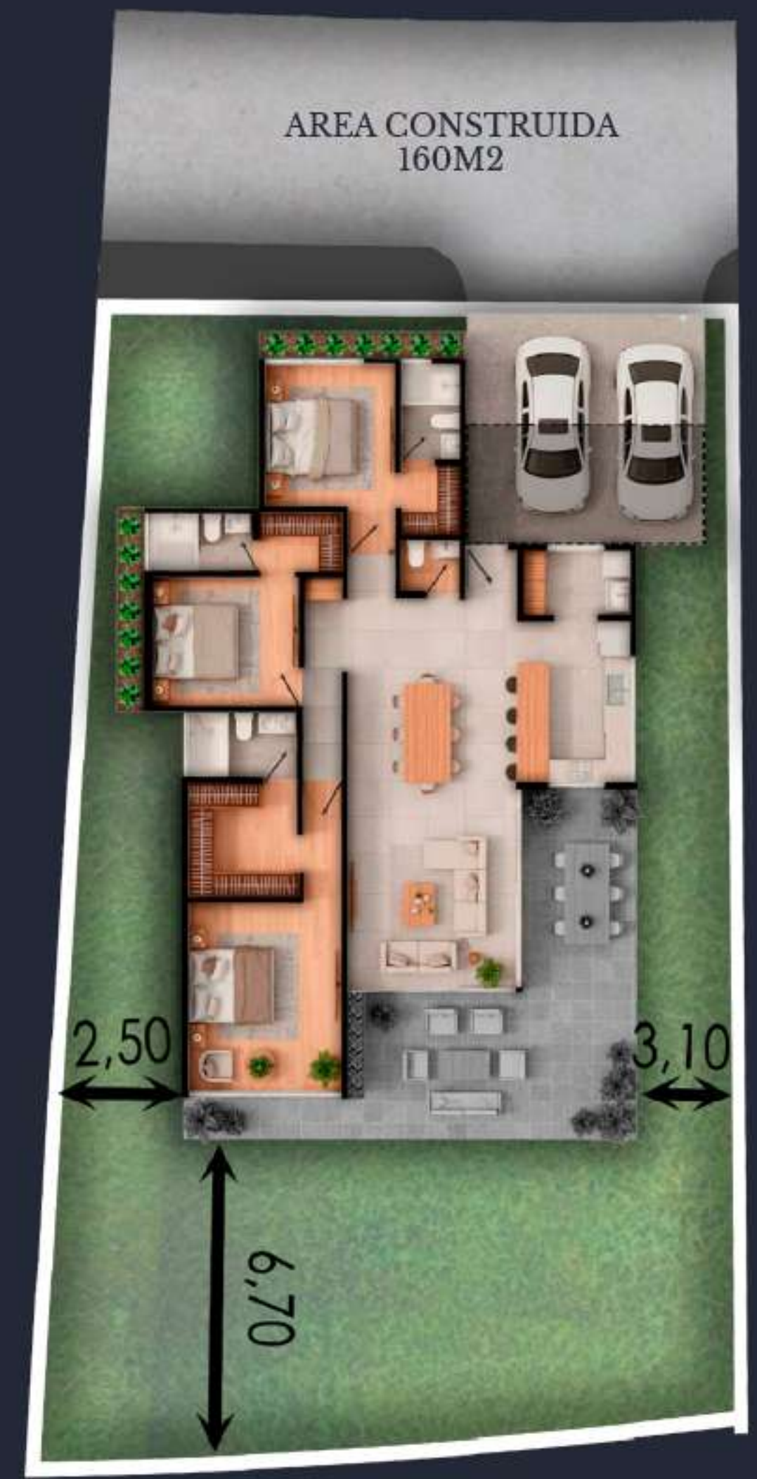
02A AREA DEL LOTE 427 M2