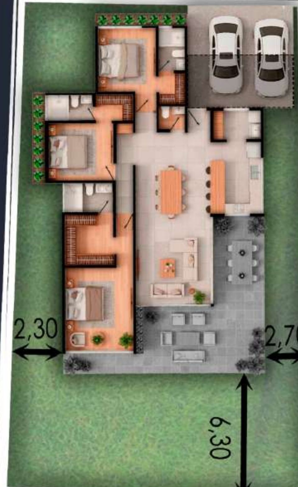
03B AREA DEL LOTE 409 M2