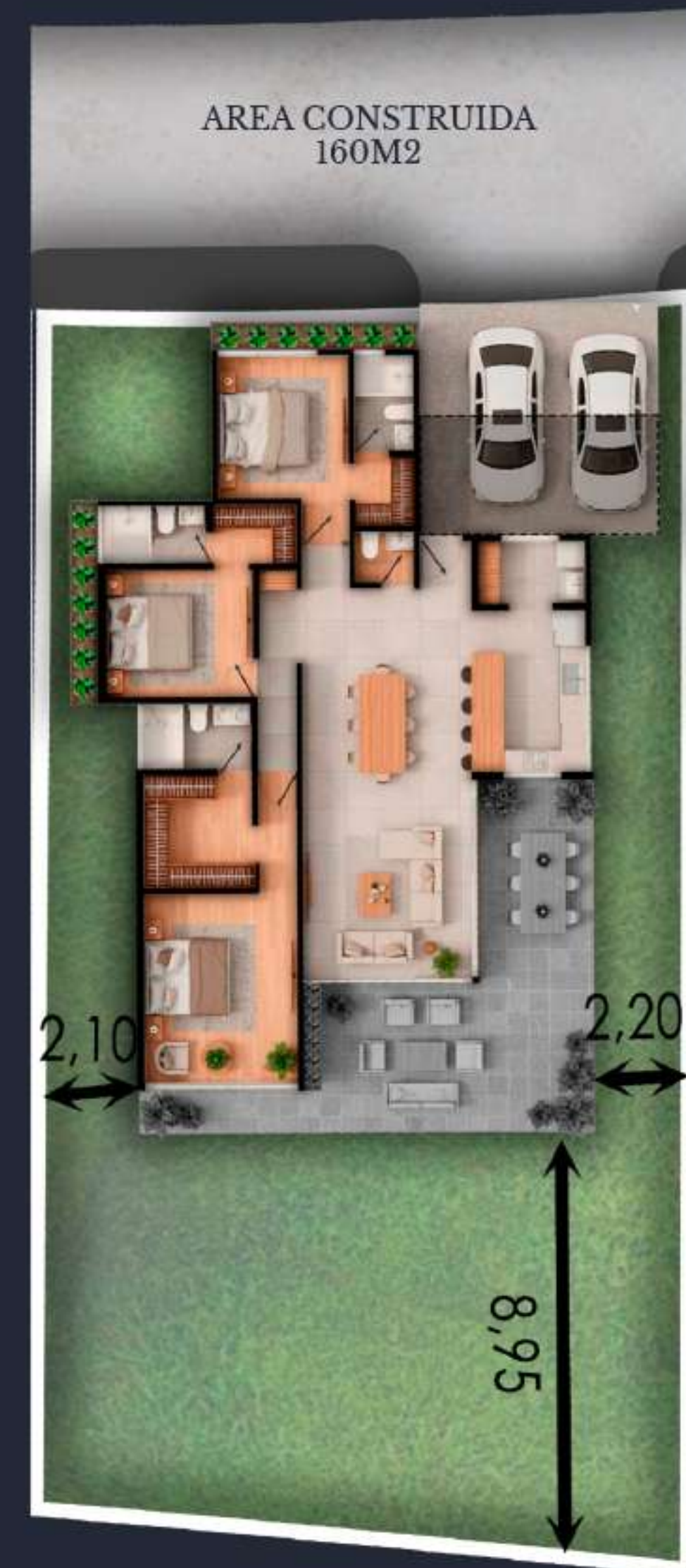
05 AREA DEL LOTE 465 M2