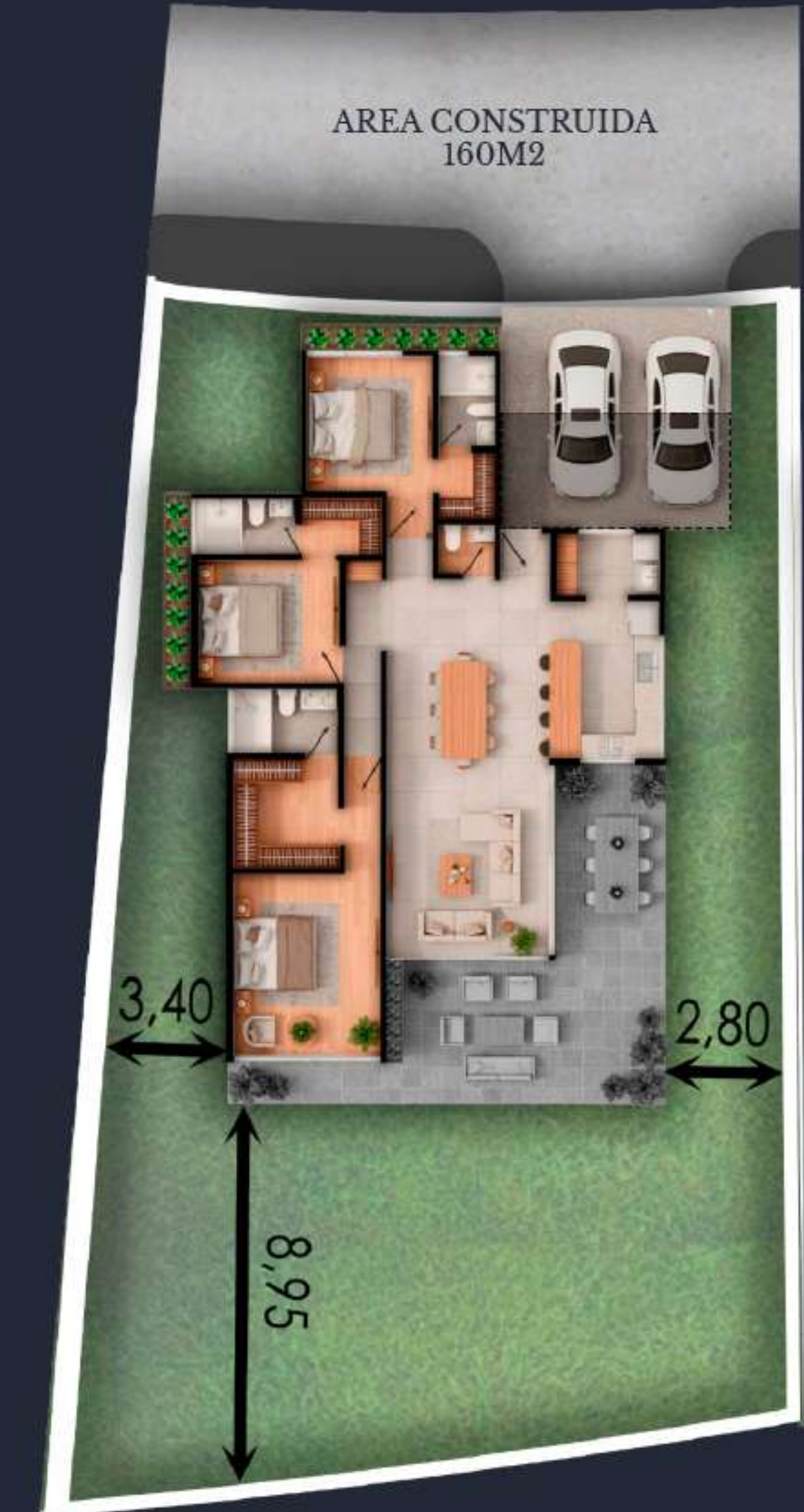
01B AREA DEL LOTE 454 M2