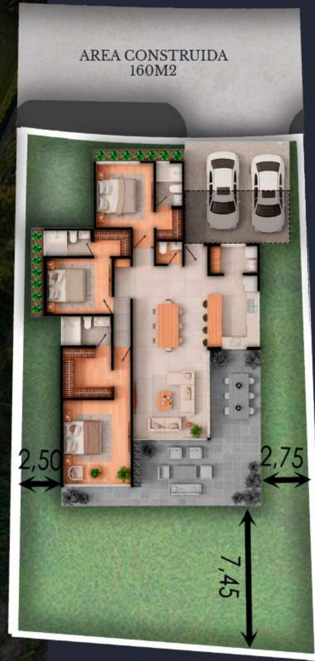
04A AREA DEL LOTE 427 M2