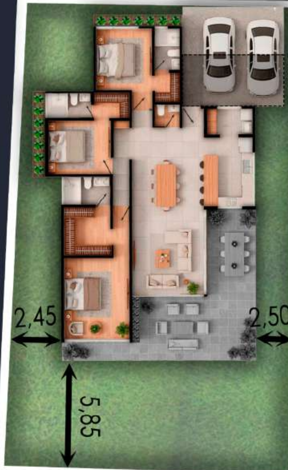
03A AREA DEL LOTE 402 M2