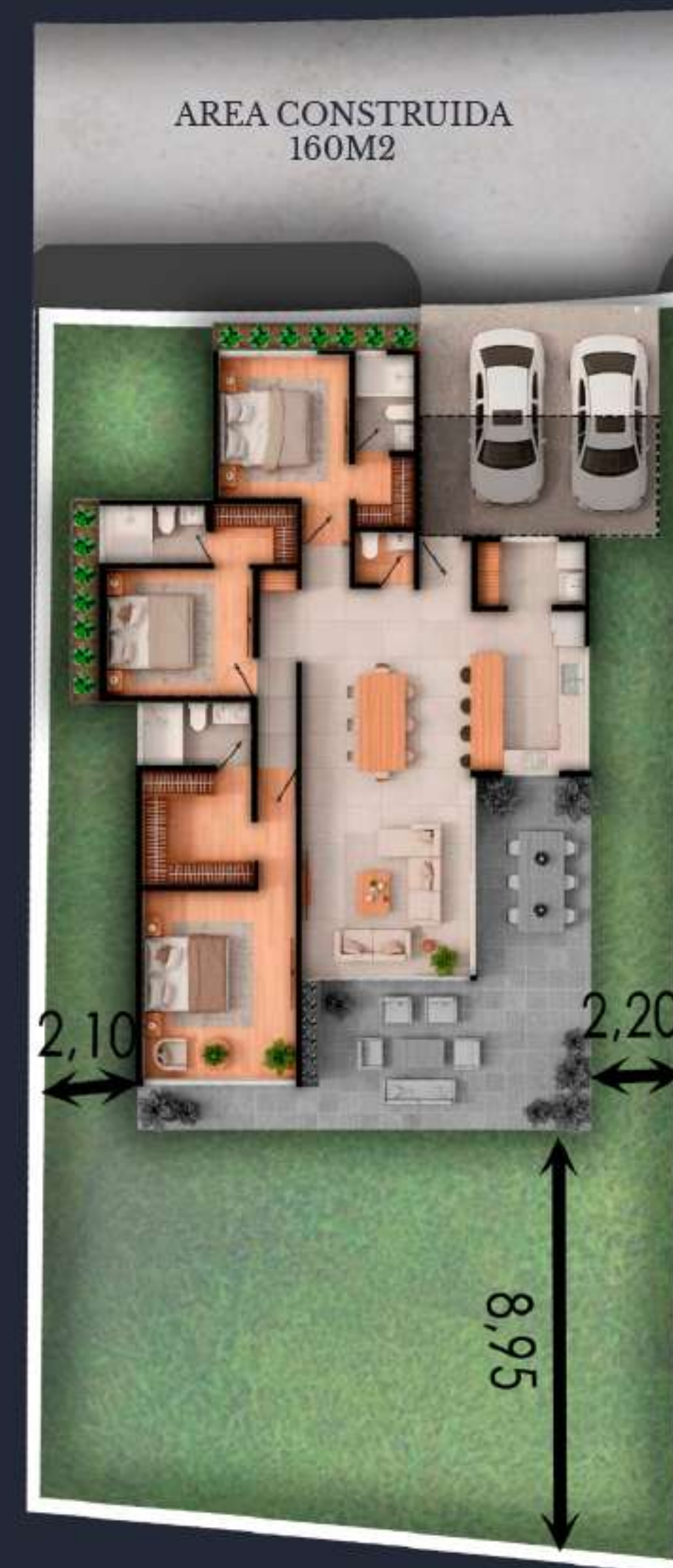
04B AREA DEL LOTE 431 M2