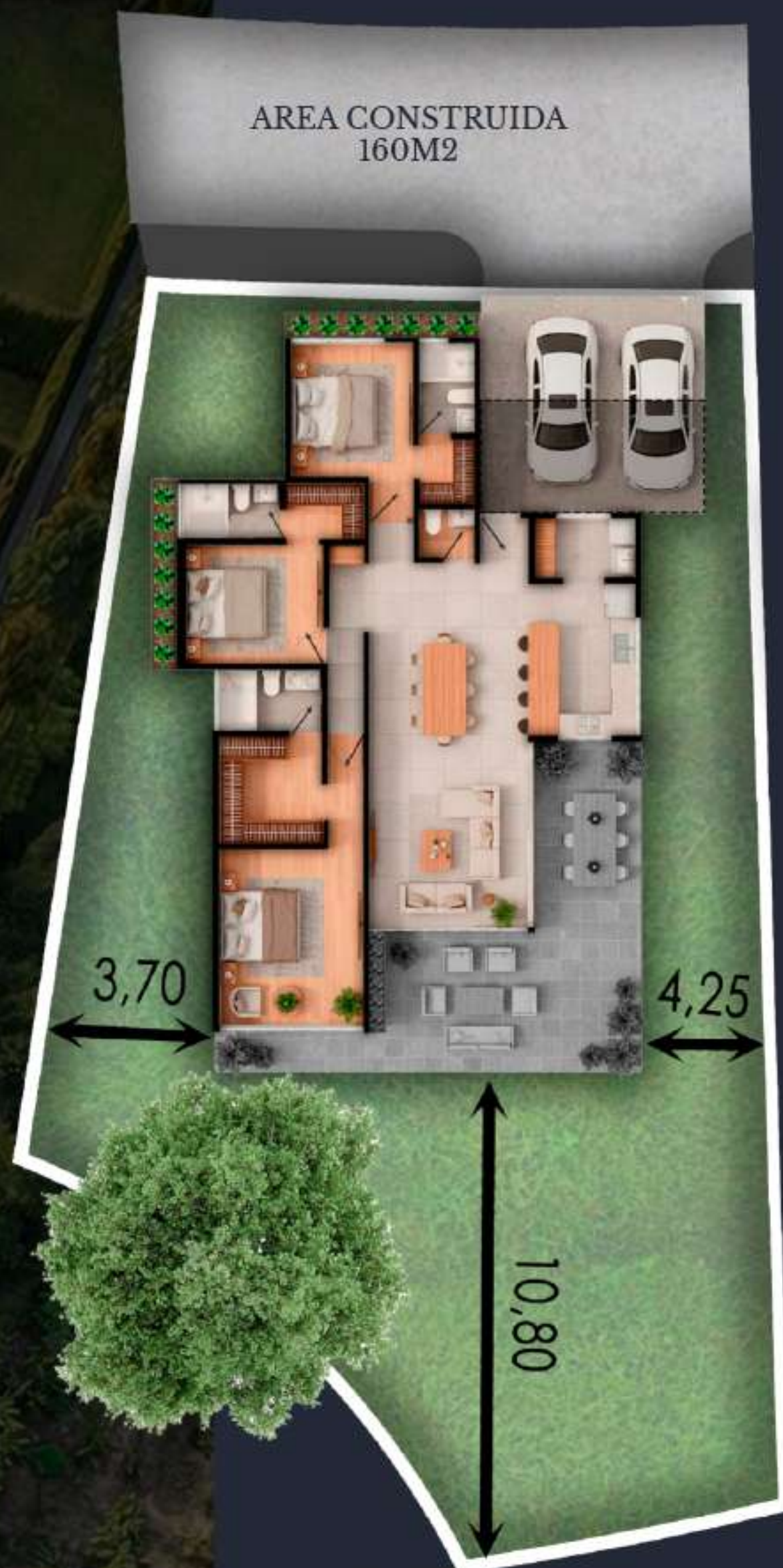
01A AREA DEL LOTE 488 M2